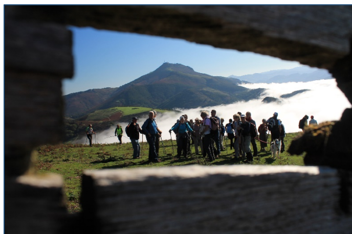
Abeilles, Aire Leku.

Le même jour Jakintza a tenu un stand à la foire aux livres de Saint-Pée-sur-Nivelle.